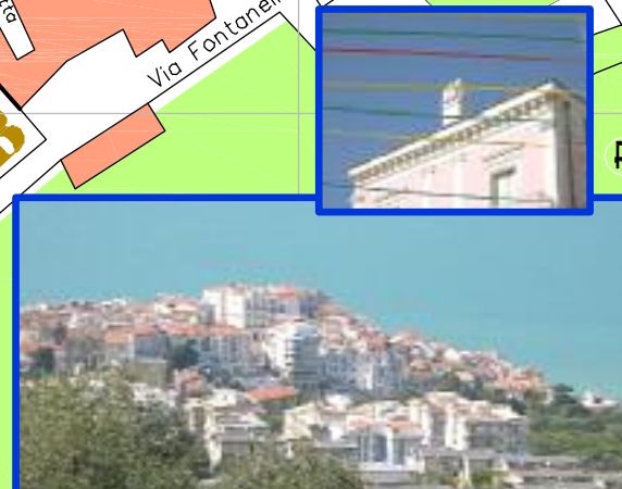
RODI - PANORAMA CENTRO STORICO

Percorso consigliato per persone diversamente abili