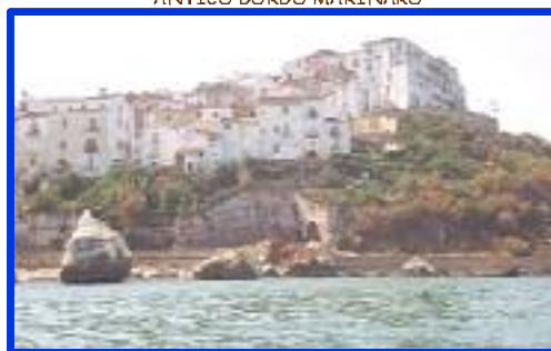
ANTICO BORGO MARINARO